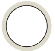
Diagrama de sortijas

Como puedes ver en el dibujo de la derecha, el círculo gris sería un ejemplo de cómo debería colocarse el anillo. En el caso de que tu anillo se sitúe entre dos de los círculos, tu medida será el número intermedio, por ejemplo 14,5.